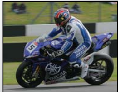
Englische Superbike und R1 Cup Teams

Motorradtester und Presse (England) – SUN, MCN, Bike, Ride, Motorcycle Racer, TWO, Fast Bikers, Superbike und Motorcycle Sport & Leisure.